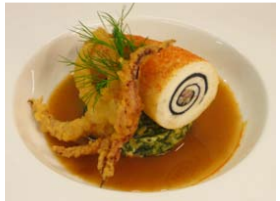
Francis Scordel Vainqueur Trophée automne 2015